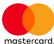
Эмблема после апреля 2017