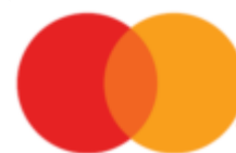
Эмблема после января 2019

Эмблема Mastercard представляет собой два круга красного (слева) и желтого (справа) цветов, пересекающиеся вдоль горизонтальной оси примерно на одну треть диаметра;